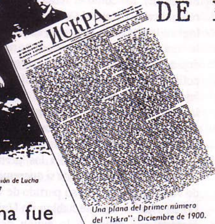
Una plana del primer número del "Iskra". Diciembre de 1900.