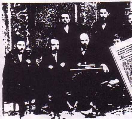
V. I. Lenin aparece junto con los miembros del círculo Unión de Lucha por la Emancipación de la Clase Obrera. Febrero de 1897