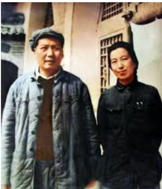
Vista lograda en la Base de Apoyo de Yenán. El Presidente Mao Tse Tung y la Camarada Chiang Ching. Abanderados de la Gran Revolución Cultural Proletaria. El Maoísmo, la Tercera, Nueva y Superior etapa de la ideología del proletariado.