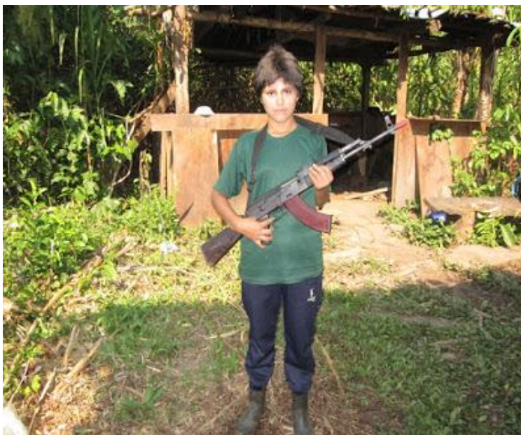
Foto de un combatiente

“NUESTRA DECISIÓN FERROZ DE COMBATIR HASTA LA ÚLTIMA GOTA DE SANGRE, EN DEFENSA DEL PARTIDO Y LA REVOLUCIÓN, BAJO LAS INVICTAS BANDERAS DEL MARXISMO-LENINISMO-MAOISMO, PENSAMIENTO GONZALO; INSTAURAR LA REPÚBLICA POPULAR DEL PERU: DE NUEVA DEMOCRACIA Y SIN INTERMEDIO ALGUNO CONSTRUIR EL SOCIALISMO, MANTENER EL PODER DE LA CLASE OBRERA, MEDIANTE SUCESIVAS REVOLUCIONES CULTURALES Y JUNTO A LOS PUEBLOS DEL MUNDO, ALCANZAR EL BELLO Y DORADO COMUNISMO, META FINAL DE LA HUMANIDAD”.