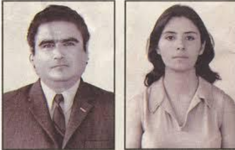
El doctor Abimael Guzmán Reinoso, Presidente Gonzalo, Presidente del Partido Comunista del Perú y Augusta La Torre Carrasco, camarada Norah. Maestro de Comunistas, el águila del Partido. Una vida total y cabalmente dedicada al Partido y la Revolución.