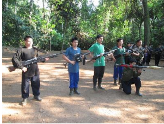
COMBATIENTES DEL EJÉRCITO POPULAR DE LIBERACION. PARTIDO COMUNISTA DEL PERU, MARXISTA-LENINISTA-MAOISTA, PENSAMIENTO GONZALO. PAMPA AURORA SETIEMBRE DEL 2013. AL NORTE DE LA PROVINCIA DE HUANTA, ZONA DEL GUERRERO VIZCATAN.