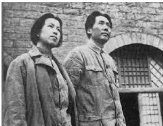
El Presidente Mao Tse Tung y la camarada Chiang Ching, en la base de apoyo de Yenán.