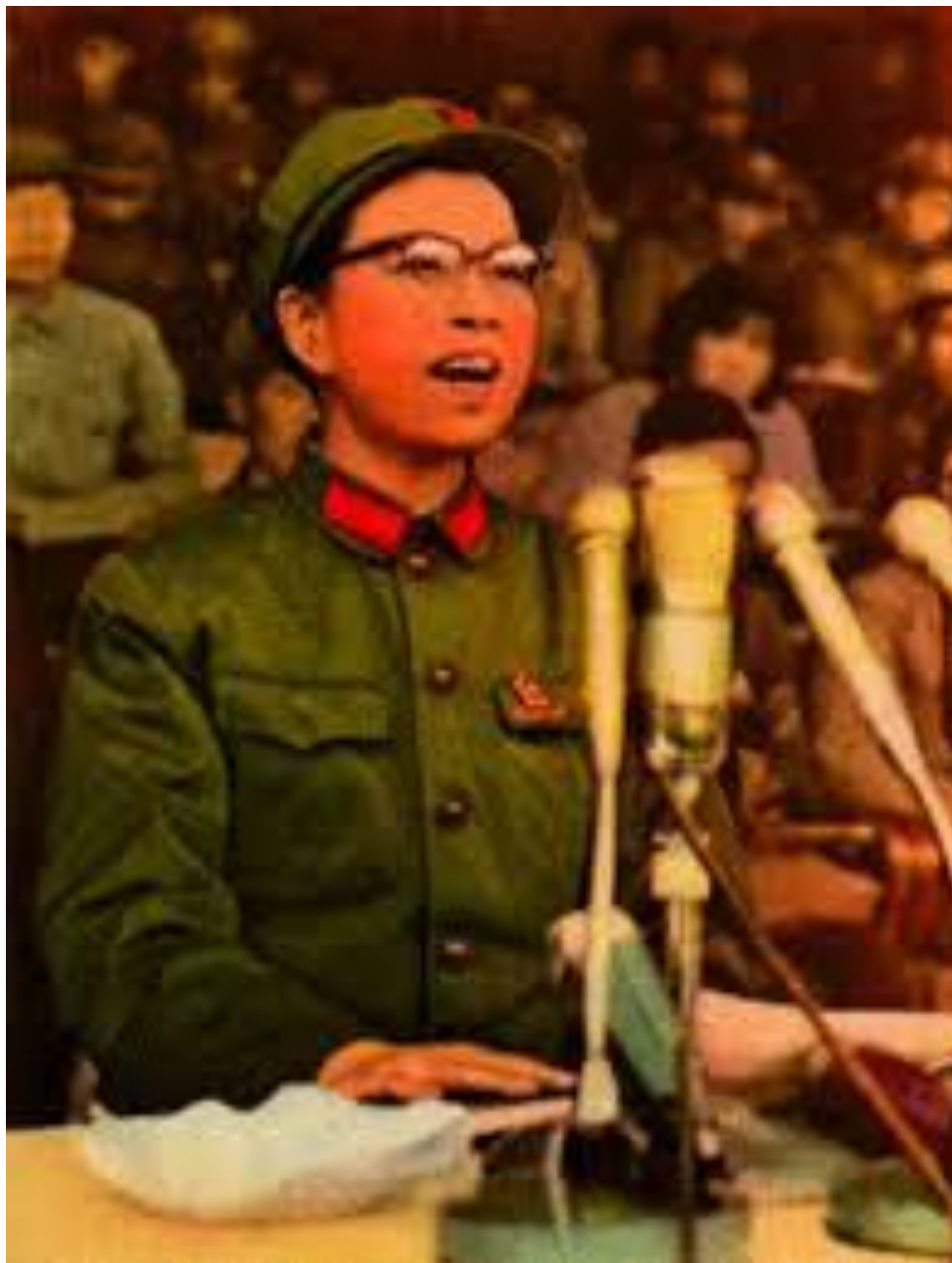
LA CAMARADA CHIANG CHING, ABANDERADA DE LA GRAN REVOLUCIÓN CULTURAL PROLETARIA. COMPAÑERA, CAMARADA Y FIEL DISCÍPULA DEL PRESIDENTE MAO TSE TUNG.

gobierno reaccionario del Perú llamado de la verdad, con el mayor cinismo y descaro ha trabajado para el gobierno reaccionario del Perú, en salvaguarda de los intereses de los explotadores y en detrimento del pueblo peruano.