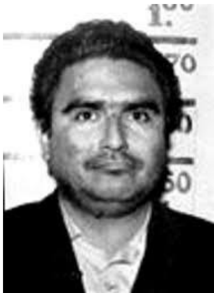
Dr. Abimael Guzmán Reinoso, Presidente Gonzalo. Jefe del Partido Comunista del Perú, Gran Marxista-Leninista-Maoísta, Pensamiento Gonzalo.

“LA TAREA CENTRAL Y LA FORMA MAS ALTA DE TODA REVOLUCIÓN ES LA TOMA DEL PODER POR MEDIO DE LA LUCHA ARMADA, ES DECIR, LA SOLUCIÓN DEL PROBLEMA POR MEDIO DE LA GUERRA. ESTE REVOLUCIONARIO PRINCIPIO MARXISTA-LENINISTA-MAOISTA, PENSAMIENTO GONZALO, TIENE VALIDEZ UNIVERSAL, TANTO EN EL PERÚ COMO EN LOS DEMÁS PAISES”. (Comité Central del Partido Comunista del Perú).