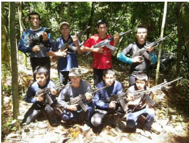
Combatientes del Ejército Popular de Liberación, en el sector denominado Churrubamba, Provincia de Huanta- Ayacucho. Febrero del 2012.

¿En qué consiste la Solución Política a los Problemas derivados de la Guerra , por el cual tanto se desgañitan los oportunistas del movadef? En el mundo existen dos concepciones, dos formas de ver los problemas políticos, dos partes en contienda. El gobierno reaccionario del Perú, que representa a los grandes banqueros, los grandes terratenientes y la gran burguesía en sus dos facciones, compradora y burocrática, ellos detentan el poder y son la clase opresora; esto por una parte. Y, por otra parte, el pueblo peruano: Obreros, campesinos, pequeña burguesía e incluso la burguesía nacional; ellos son la clase oprimida.