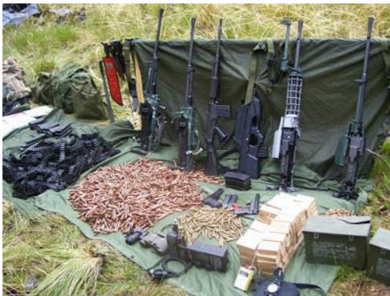
Derribo y emboscada en Sinaycocha. 02 de Setiembre del 2009. Santo Domingo de Acobamba. Junín. Helicóptero MI 17 FAP Nro. 640.

Así las cosas, ¿en qué quedó la denominada derrota de sendero , derrota del terrorismo , acuerdo de paz , la pacificación nacional y otras tantas diatribas? Creemos firmemente que todo esto es una infamia contra el Partido. Con fervor revolucionario desplegamos al viento las rojas banderas de la rebelión. ¡Viva la Guerra Popular! ¡La rebelión se justifica! ¡Tomar los cielos por asalto! Nuestra arma invencible: El Marxismo-Leninismo-Maoísmo, Pensamiento Gonzalo. Los reaccionarios dicen: Rinde tus armas . Nosotros le respondemos: Ven a tomarlas . Una vez más levantamos al tope la consigna del Presidente Mao: Quien no teme morir cortado en mil pedazos se atreve a desmontar al emperador.