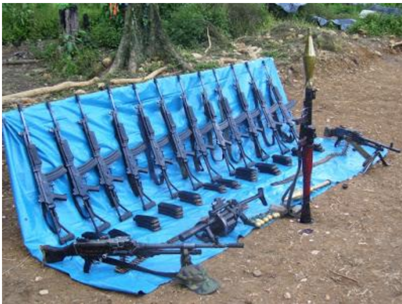
Emboscada en Ccompipata. Sanabamba. Huanta. Ayacucho. 09 de Abril 2009.