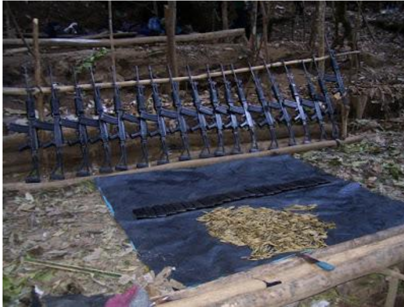
Emboscada en Tintay Puncu. Tayacaja. Huancavelica. 09 de Octubre del 2008.