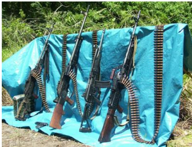
Armamento confiscado el 02 de octubre de 1999. Sector Mina. Rio Saniveni. San Martín de Pangoa. Un helicóptero MI-17 Nro. 633 emboscado.